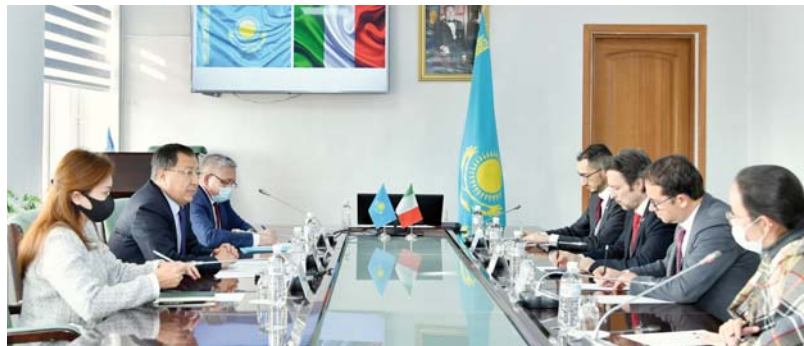
Соңы. Басы 1-бетте

Бұл жобаға Еуропаның үш мемлекетінен (Италия, Германия, Польша) және Орталық Азияның үш елінен (Қазақстан, Өзбекстан, Тәжікстан) 11 университет қатысып жатыр. Осыған орай, ЖОО жетекшісі Италия мен Қазақстан ЖОО-лары арасындағы байланыстың одан әрі дамуына қолдау көрсетуін сұрады.