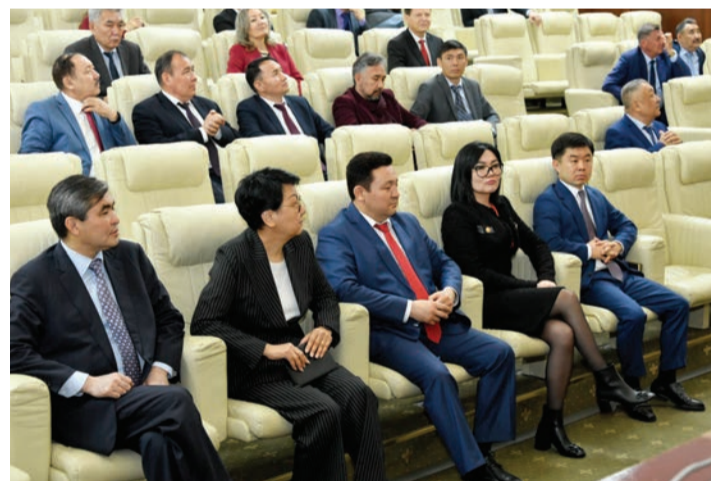
Соңы. Басы 1-бетте

«ҚазҰУ тек ғылым мен білімнің ғана емес, сонымен қатар көптеген республикалық және халықаралық іс-шаралардың орталығына айналуда», – деп атап өтті университет басшысы.