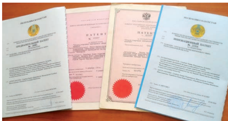
«Нововалидол-2» алу әдісіне Қазақстан мен Ресейден берілген патенттер

валидолдың дамуына арнады. Бірақ, өкінішке қарай, өндіріске енгеніне куә бола алмады. Біз ғалымның ізбасарлары ретінде нововалидол, корвалол-к, салицил қышқылы, аспирин, ПАСК және т.б. жаңа дәрі-дәрмектердің синтезі секілді оның ғылыми бағыттарын жалғастырып келеміз. Қазіргі уақытта «Валидол» препаратының өнеркәсіптік өндірісі (Украина, Ресей) күкірт қышқылының қатысуымен изовалериан қышқылын ментолмен этерификациялау реакциясымен ментилзалират синтезіне негізделген. Ментилзалиратты алудың мұндай технологиясы техникалық-экономикалық көрсеткіштердің төмендігімен және бөгде қоспалардың болуына байланысты өнім сапасының төмендігімен сипатталады. «Валидол» (АФ «Фармак», Украина) препаратының тауарлық өнімі 11 қоспадан тұрады, олардың құрамы 8%-ға жетеді, – дейді Әл-Фараби атын-