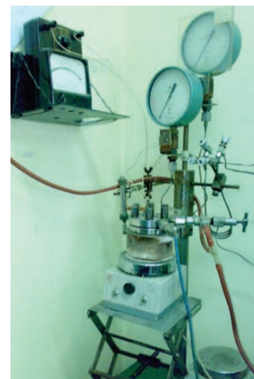
«Нововалидол» алуға арналған зертханалық қондырғы