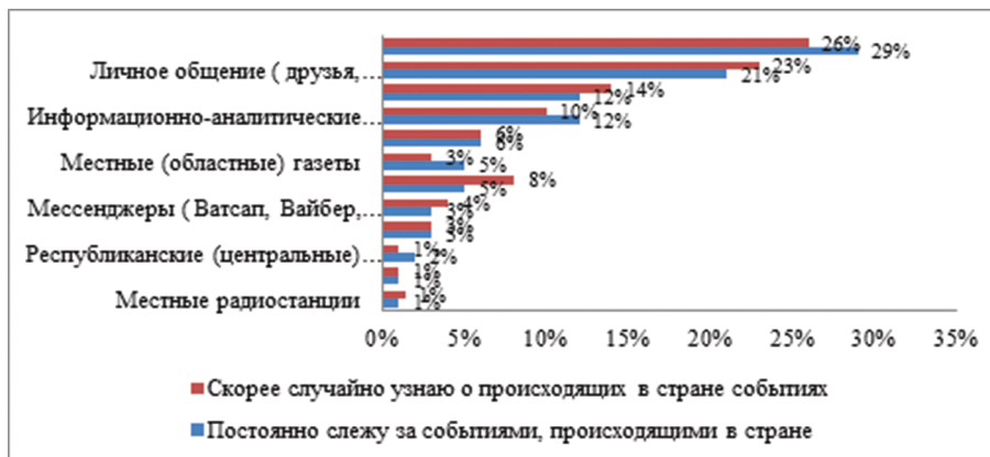
Диаграмма 3. – Рейтинг источников дополнительной информации в зависимости от уровня информированности респондентов? (% от общего числа опрошенных; неограниченное число ответов)

Рейтинг дополнительных источников информации подтвердил кредит доверия у населения таких каналов, как личное общение, республиканское и местное телевидение. В случае необходимости дополнительной информации 26% обратится к республиканским телеканалам, 22% – проконсультируется с друзьями/знакомыми, 13% – посмотрит местные телеканалы. Привлекает внимание тот факт, что в качестве обычного источника информации информационно-аналитические сайты в рейтинге заняли только 8 место, а в качестве дополнительного источника информации они занимают 4 позицию (12%). Участники фокус-групп отмечают, что на казахстанском телевидении часто ощущается недостаток информации по причинам ее полного отсутствия или недостаточного раскрытия темы, который приходится восполнять за счет интернета. Таким образом, можно сделать вывод, что \frac{3}{4} респондентов в поисках дополнительной информации воспользуются тремя каналами: телевидением, неформальными каналами и интернет-ресурсами.