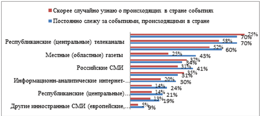
Диаграмма 2. – Рейтинг источников информации в зависимости от уровня интереса к информации респондентов? (% от общего числа опрошенных; неограниченное число ответов)

На четвертую позицию в качестве источников информации о событиях в стране претендует сразу несколько источников, доля обращений за информацией к которым варьирует на уровне 30–35%: