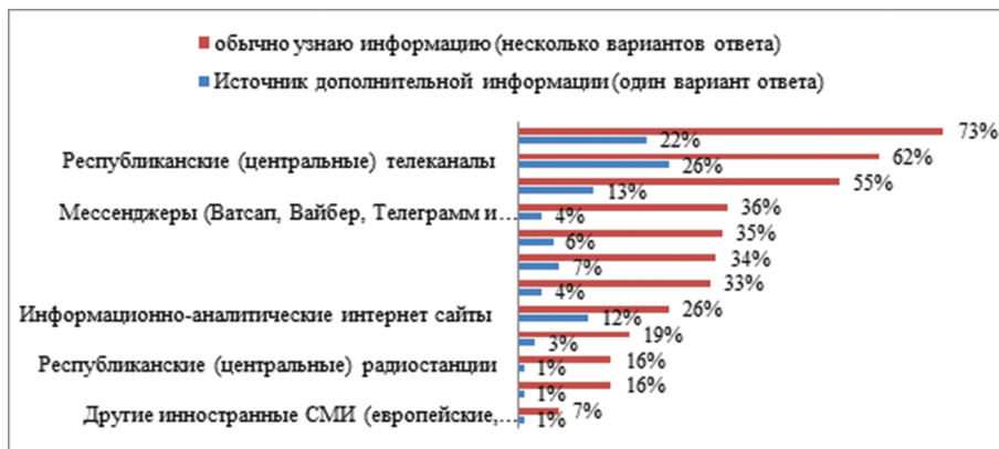
Диаграмма № 1 – К какому источнику информации вы обратитесь в первую очередь, чтобы проверить или получить дополнительную информацию о событиях в стране? (% от общего числа опрошенных; неограниченное число ответов)

Согласно результатам опроса, первое место среди источников информации занимает личное общение с друзьями. Подавляющее большинство опрошенных (73%) обычно узнает информацию о событиях в стране из бесед с друзьями и знакомыми. Социально-демографический анализ результатов показал, что подобное поведение характерно для всех групп населения. Вторым по предпочтениям источником информации служат республиканские телеканалы (62%). Чаще всего к данному источнику обращаются респонденты в возрасте 45–54 лет, с низким уровнем дохода, казахи из казахскоязычной среды. Третье место занимают местные (областные) телеканалы (ТК). Каждый второй получает информацию из этого источника (55%). Чаще всего данным источником пользуются респонденты старше 45 лет, со средним уровнем доходов, имеющие среднее образование, казахи из казахскоязычной среды.