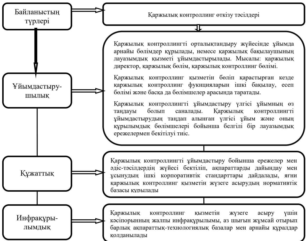
2-сурет – Қаржылық контроллингтің жалпы ұйымдастыру мен басқару жүйесімен байланысы

Зерттеу жұмысының нәтижесінде біз төменде берілген 2-сурет арқылы кәсіпорында қаржылық контроллингтің жалпы ұйымдастыру және басқару жүйесімен байланысын көрсетіп отырмыз (2-сурет).