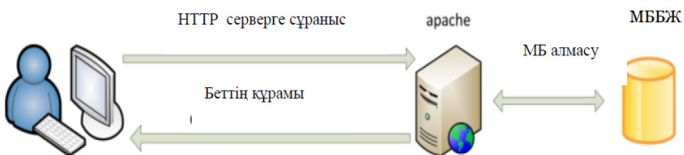
3-сурет. Web-қосымшаның жұмыс істеу сұлбасы

Web – қосымшалар негізінде жұмыс істейтін программалық қамтаманың (схема) құрылымы келесі суретте көрсетілген (3-сурет).