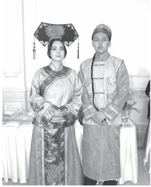
Казахстане уникален и является частью одного дружного народа под названием казахстанцы, – отметил Б.Другов.