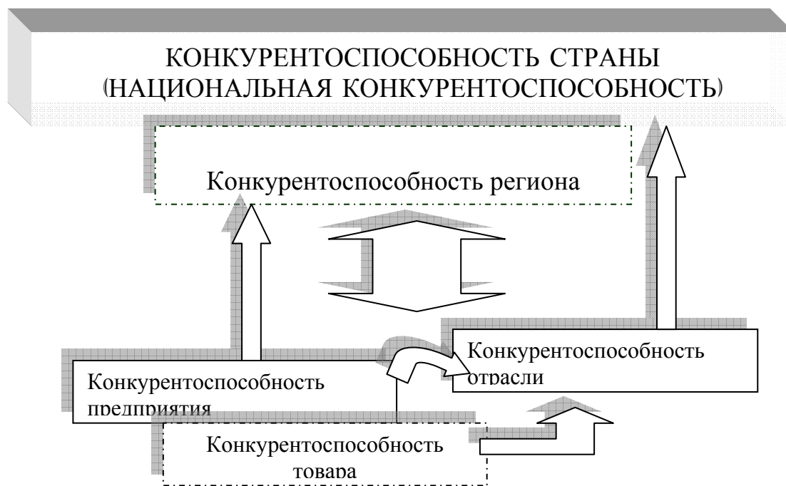
Рисунок 1 - Схема взаимосвязи понятия «конкурентоспособность» на различных уровнях экономического анализа (составлено автором)

повышении собственного экономического и инновационного потенциала с целью обеспечения высокого качества жизни населения.